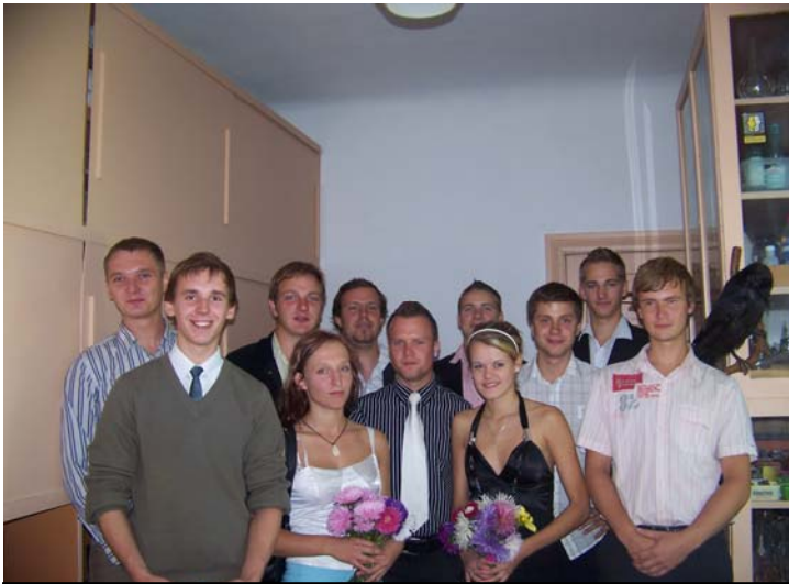
Lūk, Birzgales pamatskolas absolventu grupa, kas teicami vadīja radošās darbnīcas un iekrāsoja 1.septembra svētku dienu vēl spilgtākos toņos.