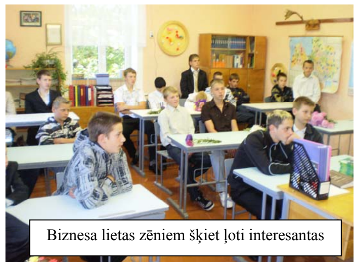
Biznesa lietas zēniem šķiet ļoti interesantas